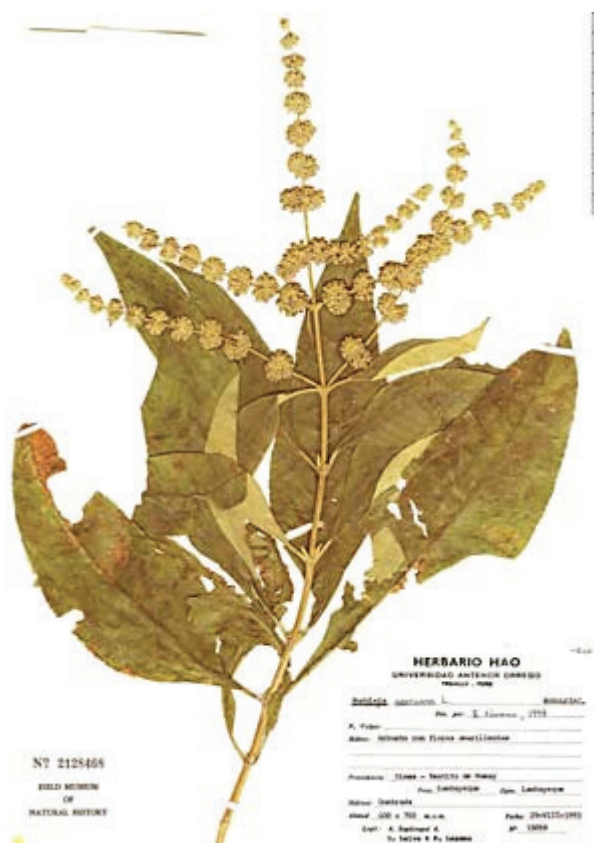
Рис. 2. Buddleja americana L.