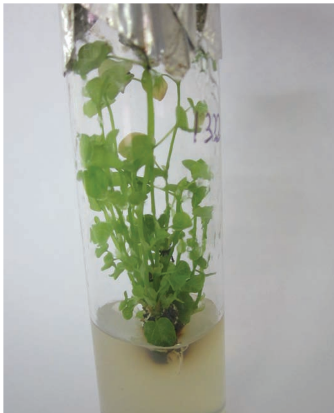
Рис. 1. Гомогенез у C. siliquastrum 'Alba' in vitro

від введення рослинного матеріалу in vitro визначали оптимальну фазу розвитку рослин під час якої вони були найбільш придатними до пересадки на живильні середовища для досягнення ризогенезу.