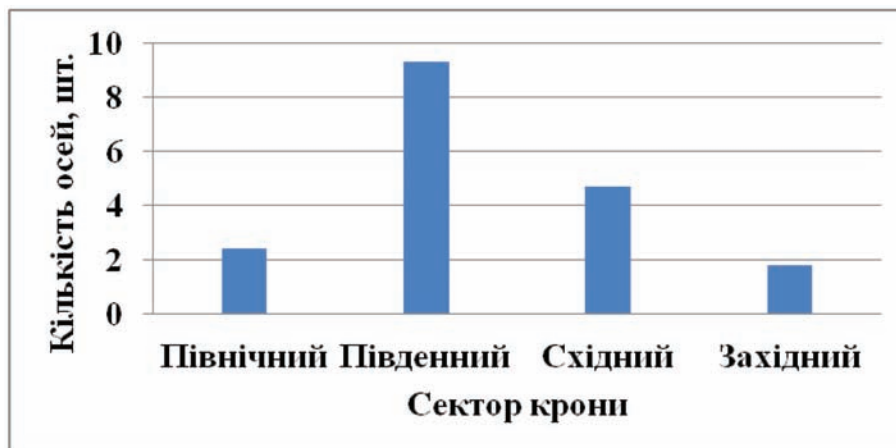
Рис. 3. Галузнення волотей S. kentukea залежно від експозиції сектора крони

крони — 9,3 \pm 0,27 шт., майже у двічі нижчий показник зафіксовано у волотей із східного сектора — 4,7 \pm 0,11 шт., найменшу кількість порядків галузень волотей виявлено у північному і західному секторах крони — 2,4 \pm 0,07 шт. та 1,8 \pm 0,05 шт. відповідно.