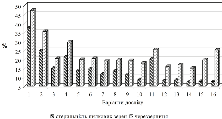
Рис. 2. Вплив позакореневих підживлень мікродобривами на стерильність пилкових зерен і череззерницю ячменю ярого (2009–2011 рр.).

здатністю рослин ячменю ярого та стерильністю пилку — r=0,92 , а також між стерильністю пилкових зерен наприкінці виходу в трубку і рівнем череззерниці у фазу повної стиглості — r=0,93 .