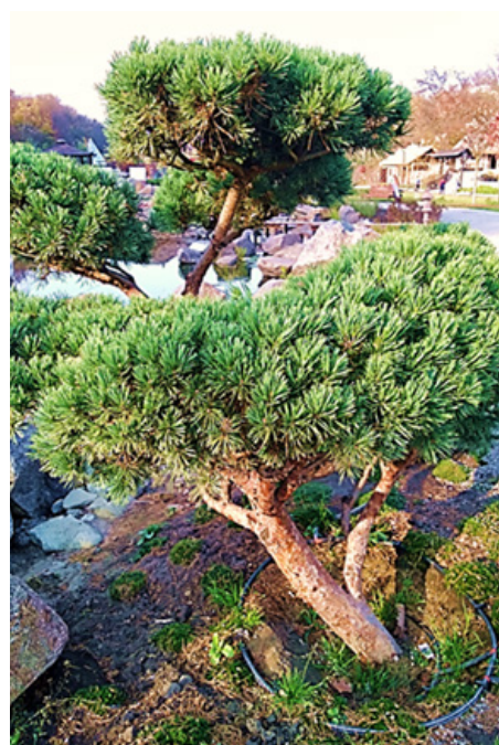
Рис. 10. Гірська сосна ( Pinus mugo Turra)