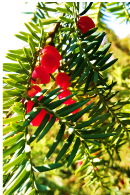
Рис. 9. Плоди Taxus baccata L.

Dunin-Borkowski, J. (1908). Potocki herbu Pilawa. Almanach błękitny: Genealogia żyjących rodów Polskich . Lwow: Nakładem księgarni H. Altenberga; Warszawa: E. Wende i Ska. P. 729–773.