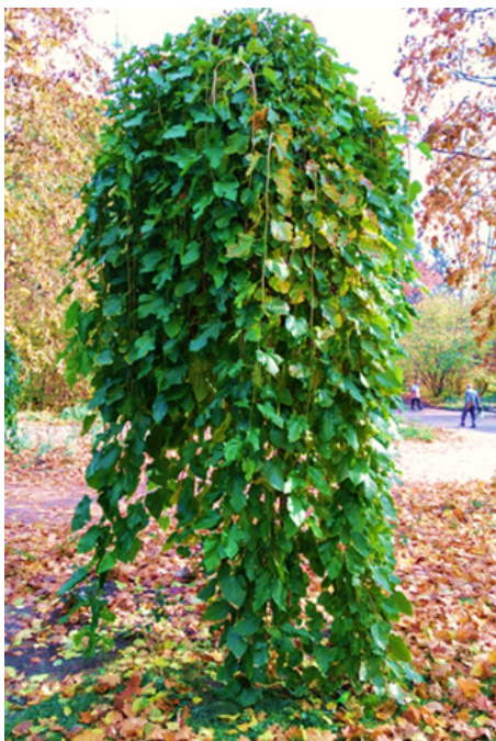
Рис. 7. Молоде дерево шовковиці плакучої ( Morus alba 'Pendula')

Родина Кипарисових ( Cupressaceae Gray) представлена в «Софіївці» трьома видами та 8 сортами кипарисовика ( Chamaecyparis Spach); 10 видами та 48 сортами ялівцю ( Juniperus L.) й лише одним видом мікробіоти ( Microbiota decussata Kom.); одним видом і сортом біоти ( Platyclusus orientalis (L.) Franco 'Glaucа'); двома сортами туйовика ( Thujaopsis dolabrata (L. f.) Siebold & Zucc.); двома видами та 16 сортами туї ( Thuja L.).