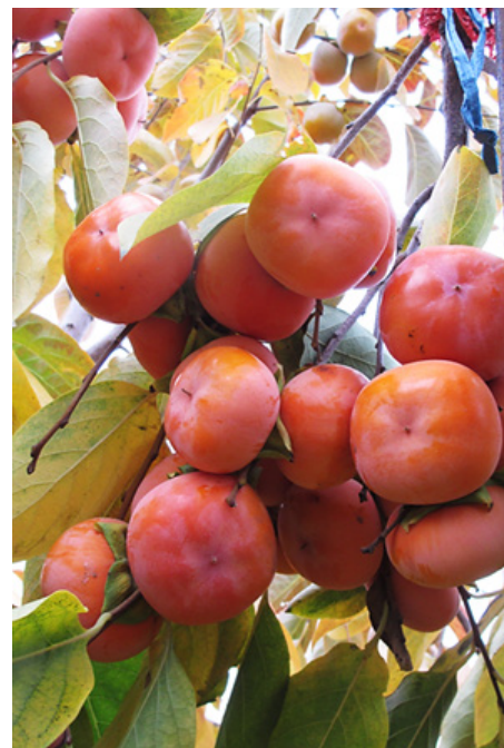
Рис. 6. Плоди нового сорту хурми ( Diospyros spp.) 'Дар Софіївки' (плоди масою 130–150 грамів)