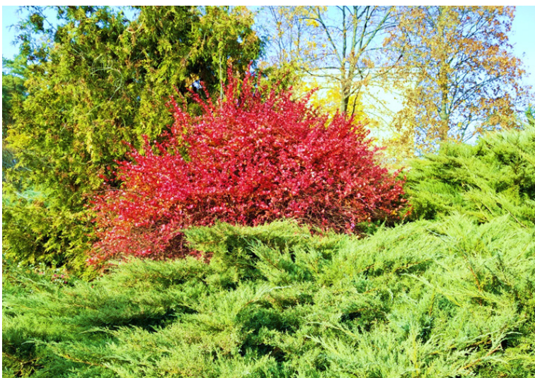
Рис. 8. Кущ барбарису ( Berberis vulgaris 'Атропурпуреа') на фоні туї східної ( Thuja occidentalis L.) і ялівцю горизонтального ( Juniperus horisontalis Moench. 'Glaucа')

У цій частині «Софіївки» особливо привабливі хвойні рослини, зокрема повзуча або карликова гірська сосна ( Pinus mugo Turra), що належить до родини соснових ( Pinaceae Lindl.) і представлена в парку як невелике деревце (Рис. 10).