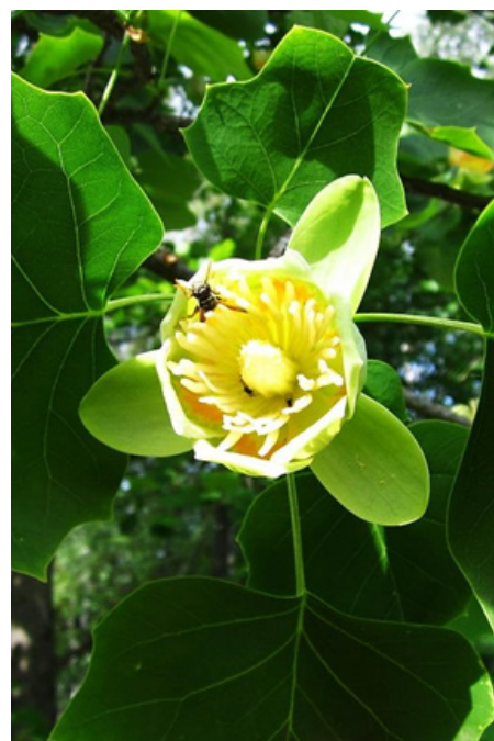
Рис. 4. Квітка Liriodendron tulipifera

Так, наприклад, біля сходів до партерного амфітеатру розміщувався апельсиновий масив, на березі потічка красувалися сосна австралійська ( Casuarina equisetifolia L.) та південна магнолія ( Magnolia grandiflora L.) й інші екзотичні для України рослини. До періоду заснування також належать висаджені у парку платан ( Platanus occidentalis L.), гледічія ( Gleditsia triacanthos L.), сосна Веймутова ( Pinus strobus L.), глід ( Crataegus spp.), каштан кінський ( Aesculus hippocastanum L.), ясен плакучий ( Fraxinus excelsior L. 'Pendula'), туя східна ( Thuja occidentalis L.), сосна ( Picea spp.), робінія псевдоакація ( Robinia pseudoacacia L.), жарновець віниковий ( Cytisus scorpius (L.) Link), та карагана ( Caragana arborescens Lam.). У цей період також було посажене тюльпанове дерево ( Liriodendron tulipifera L.), однак те дерево, дивовижні квіти якого радують око сьогодні (рис. 4), це рослина, отримана внаслідок розмноження порослю колишнього дерева (Білик та ін., 2000; Косенко, 2013).