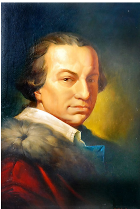
Рис. 1. Граф Станіслав Щенсний Потоцький

Результати та обговорення. Для осмислення історії «Софіївки» варто коротко ознайомитися з історією Уманщини і життям її тодішнього суверена графа Станіслава Щенсного Потоцького (Stanisław Szczesny Potocki). Уманщина, котра в ті роки входила до складу Речі Посполитої, була подарована польським королем Сигізмундом III Ваза, графу Валентину Олександровичу Калиновському, який передав її як посаг одній зі своїх дочок — Гелені. Вона в 1726 році продала маєток Станіславу Потоцькому, а він у 1732 році подарував його своєму небожу Францішку Салезію Потоцькому (Kosenko et al., 2020).