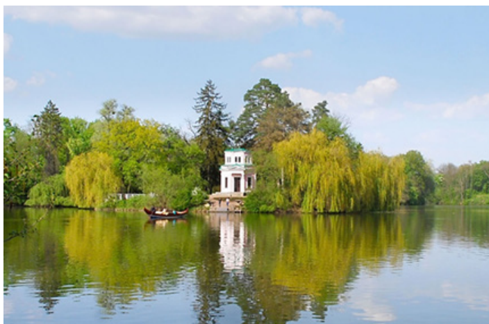
Рис. 3. Острів АнтиЦирцеї в часи заснування парку і нині (зліва — рисунок із путівника Теодора Темері (Themery, 1846); справа — фото Галини Сівко)