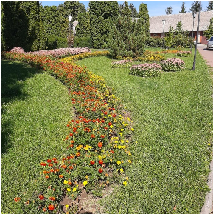
Рисунок 12. Арабеска, яка розміщується на науково-адміністративній зоні

Арабеска знаходиться по обидві сторони дороги, яка веде до внутрішнього двору науково-адміністративного корпусу дендропарку (див. табл. 1, рис. 12).