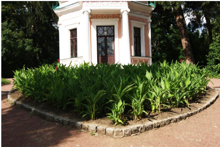
Рисунок 2. Клумба у вигляді серця на «Острові Анти-Цирцеї»