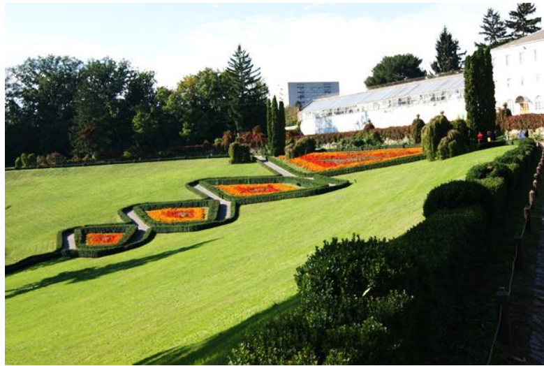
Рисунок 4. Клумби експозиційної ділянки «Партерний амфітеатр»