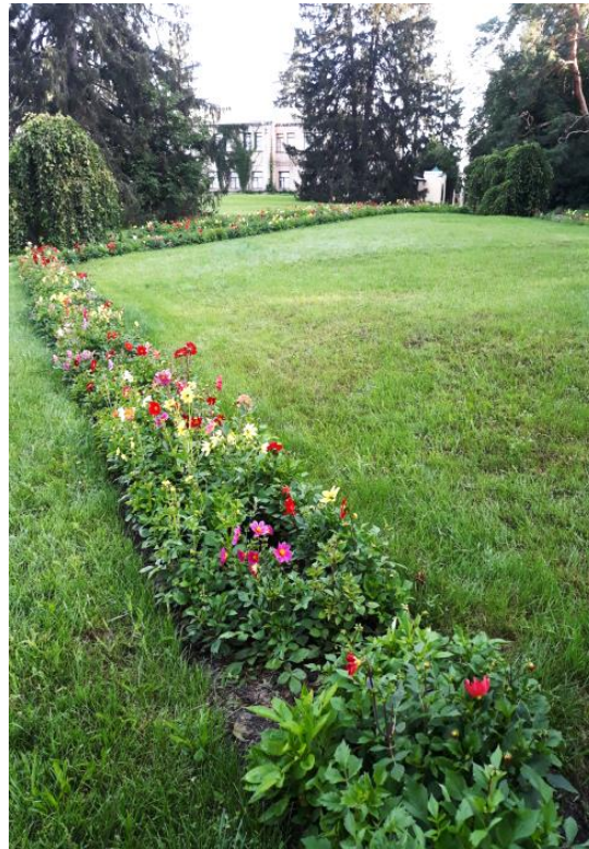
Рисунок 5. Рабатка, яка розміщується вздовж алей зі сторони «Англійського парку»