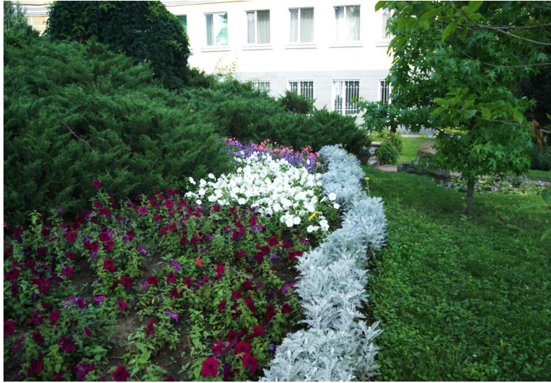
Рисунок 9. Ландшафтний квітник, який розміщується на вхідній зоні з вулиці Київської