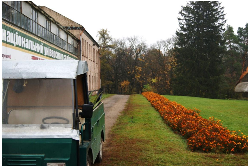
Рисунок 6. Рабатка, яка розміщується вздовж оранжерей Уманського національного університету садівництва