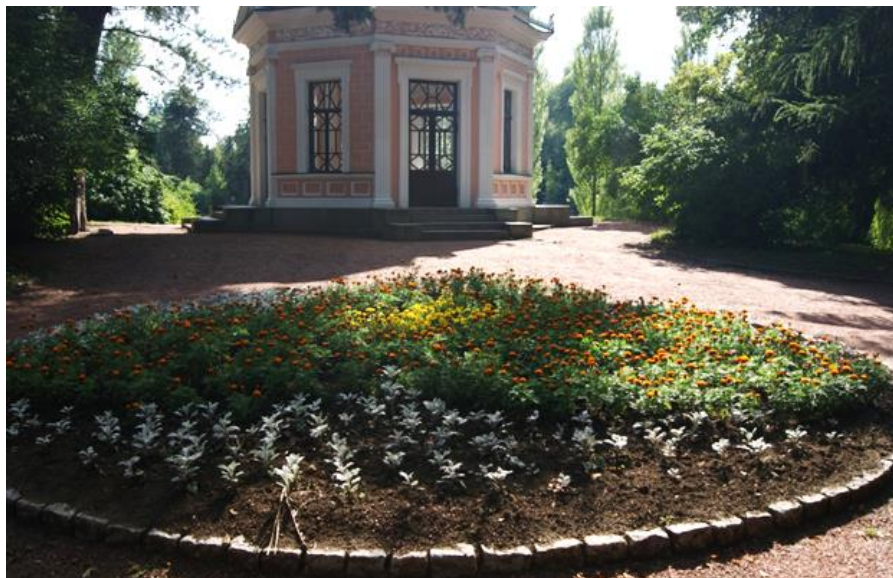
Рисунок 3. Кругла клумба на «Острові Анти-Цирцеї»

Щоб зорієнтувати основну увагу відвідувачів на експозиційній ділянці, потрібно правильно розмістити центральну точку квітника, з подальшою посадкою однорічних рослин однієї кольорової гамми, які висаджені у формі кола. Далі, в залежності від задуму, доповнюються іншими однорічними (табл. 1, 2) й багаторічними рослинами. Багаторічні рослини ми використовуємо з метою збільшення тривалості періоду декоративного ефекту клумби.