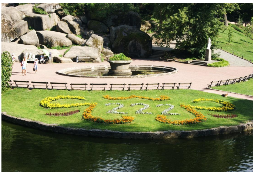
Рисунок 8. Арабеска, що розміщується на «Площі зборів»

самостійним елементом на газоні. В центральній частині квітника розміщуються цифри, які вказують на вік дендрологічного парку «Софіївка». Це змінний, однорівневий квітник. Дворічні рослини висаджуємо восени або рано навесні, а пізніше — однорічні, коли встановлюється сталий позитивний температурний режим (рис. 1, 8, табл. 1, 2). У зв'язку з високим температурним режимом, нестачею вологи у повітрі й ґрунті у літній період, відсутністю сталого автоматичного поливу та необхідністю високого декоративного ефекту центрального квітника, ми висаджуємо розсаду красиво-квітучих, килимових та декоративно-листяних рослин, вирощених у теплиці й парниках. Такі умови вимагають підбору асортименту посухостійких, світлолюбних рослин з тривалим і красивим цвітінням та яскравими листками. За роки досліджень найкраще зарекомендували рослини Tagetes patula , Cineraria maritima , Petunia × grandiflora , Lobularia maritima .