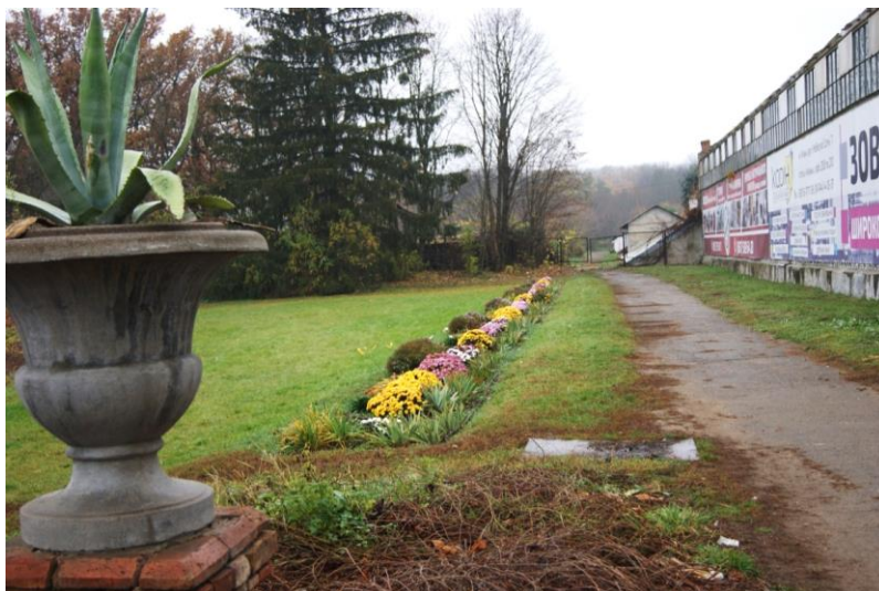
Рисунок 7. Міксбордер, який розміщується вздовж оранжерей Уманського національного університету садівництва