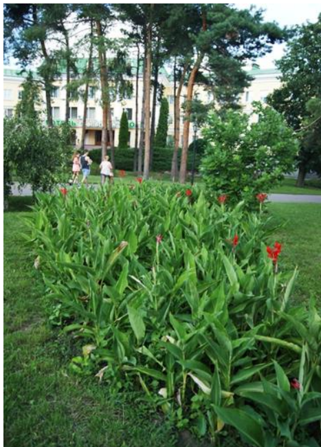
Рисунок 10. «Клумба-острівок», яка розміщується на вхідній зоні з вулиці Київської

Друга квіткова композиція на цій ділянці (рис. 1, 10) представлена «клумбою-острівком». Вона оточена газоном, що дає змогу відвідувачам парку добре оглянути її з усіх сторін. У зв'язку з рекреаційним навантаженням цієї зони, щороку ми висаджуємо на цій ділянці пророщені рослини Canna × hybrida , до 40 см заввишки. Саме це запобігає витоптуванню рослин людьми та їхніми домашніми улюбленцями. Червоні й жовті квітки Canna × hybrida створюють ефект яскравої плями в садовому пейзажі.